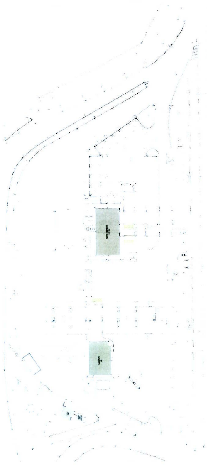
PIANTA DI AMBITO GENERALE STUDIO PER IL PROGETTO, IN RIFERIMENTO ALL'ESISTENTE IN ALTO A